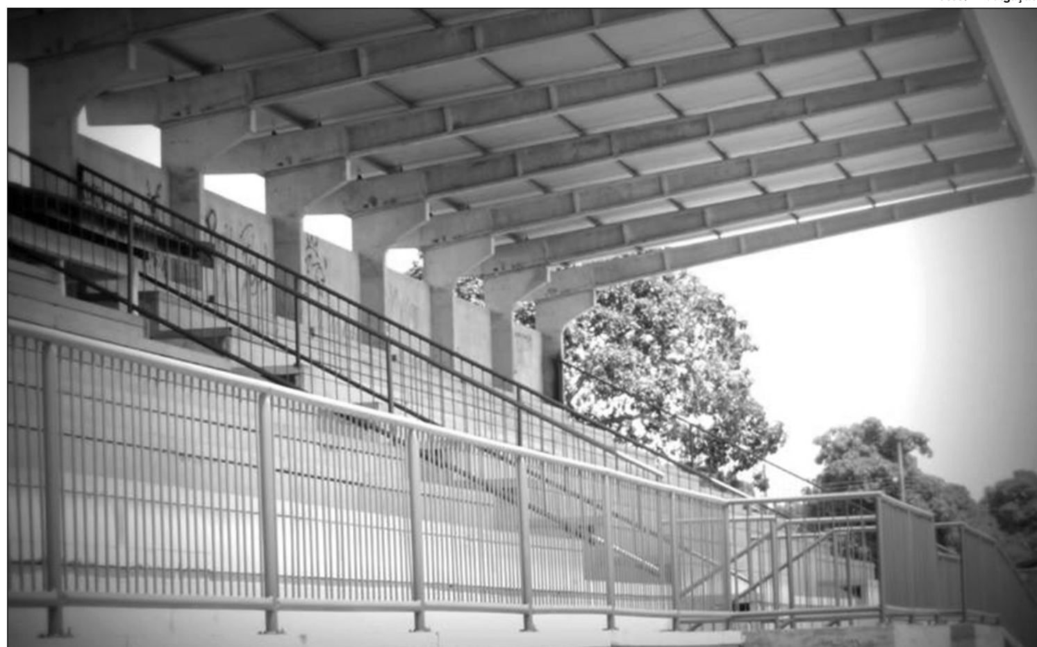
■ Alambrado cercará toda a arquibancada, num vão de mais de 140m de alambrado, com uma altura de 3,2m de altura

mos estar contribuindo com a realização de mais um sonho da população rio-verdense com mais esta obra que está sendo construída, e vai garanti mais benefício e melhorar o incentivo ao esporte e o engrandecimento da cidade, lembrando ainda que todos as peças de serralheria e alambrados foram confeccionados em uma fábrica da nossa